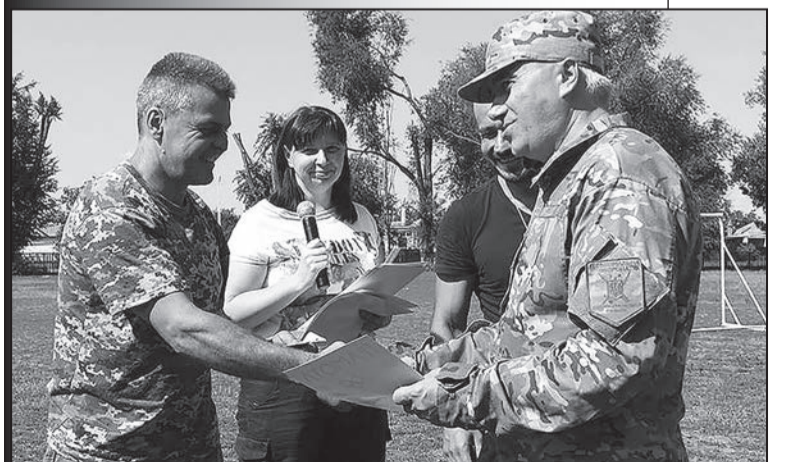
На знімках: святкові моменти козацьких герців побратимів по зброї і душы.