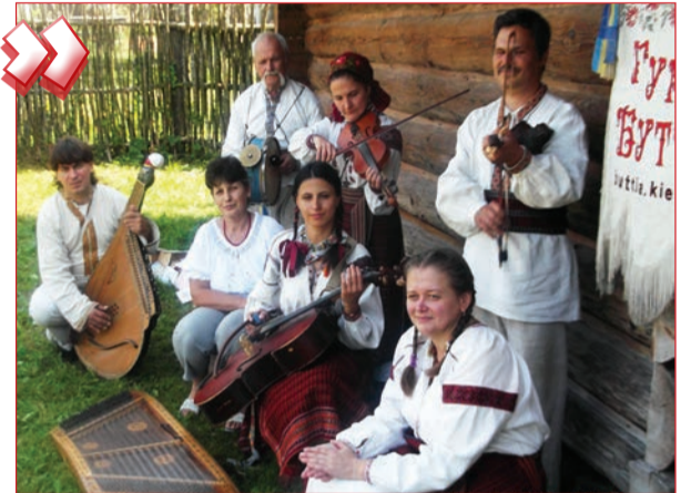
На знімку: у музеї-садибі в Нагуєвичках; гурт «Буття» біля хати Івана Франка виконує трієсту мелодій давніших часів.

Ще зовсім нещодавно шкільні підручники видавали за остаточну істину, що «знищення приватної власності на землю приведе людину до визволення з-під влади землі». І «визволяли» селянина, не пи-